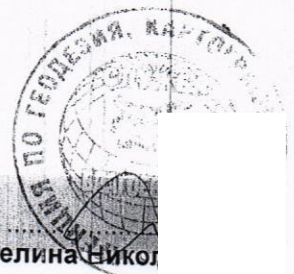
Схема № 15-328007-01.04.2024 г. издадена въз основа на заявление с входящ № 01-158462-20.03.2024 г.