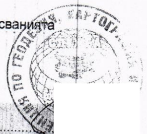
Схема № 15-328007-01.04.2024 г. издадена въз основа на заявление с входящ № 01-158462-20.03.2024 г.

Нотариален акт № 32 том 4 рег. 1032 дело 510 от 10.04.2012г., издаден от Служба по вписванията Благоевград