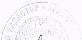
Схема № заявление