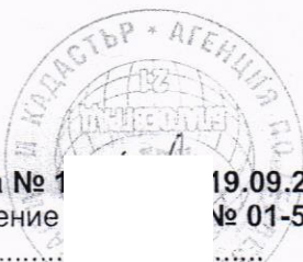
Схема № 1 заявление

19.09.2024 г. издадена въз основа на № 01-515072-19.09.2024 г.