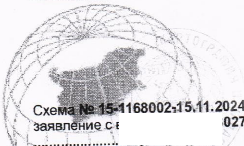
Схема № 15-1168002-15.11.2024 г. издадена въз основа на заявление с № 0275-15.11.2024 г.